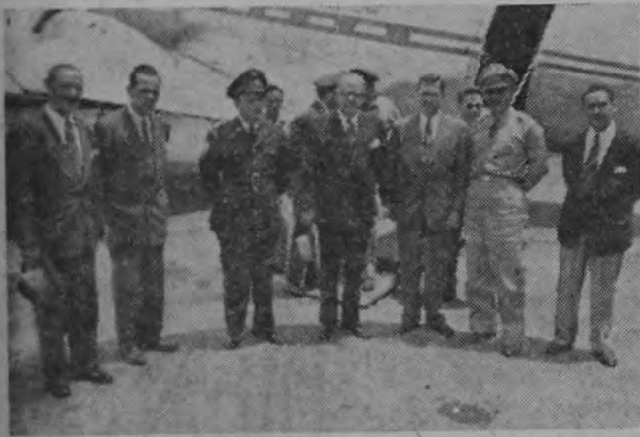
El Jefe del Protocolo de El Salvador y el Subjefe de las Fuerzas Armadas salvadoreñas, llegados ayer por vía aérea para acompañar al Presidente de Costa Rica, don Otilio Ulate, en el viaje que inicia en la mañana de hoy.

y la suspensión de la ejecución dictada a última hora por el Magistrado Douglas, tendrá vigor por lo menos hasta entonces.